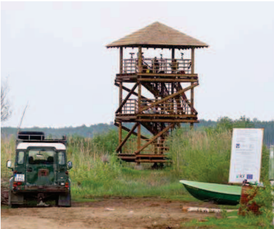
Atjaunotais tornis Sedas tīrelī.