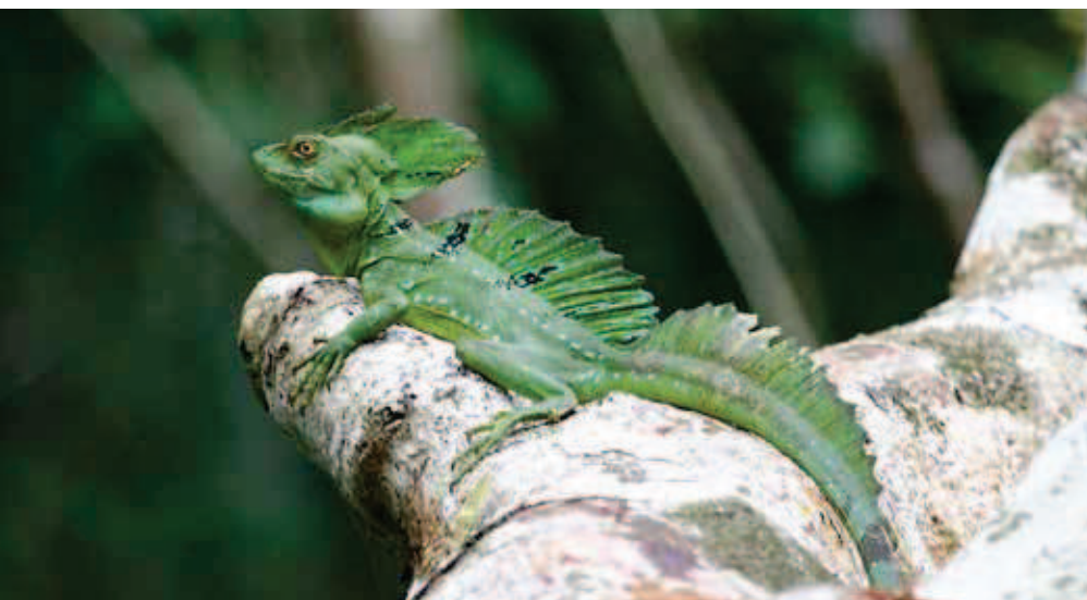
Zaļsekstes bazilisks Basiliscus plumifrons .