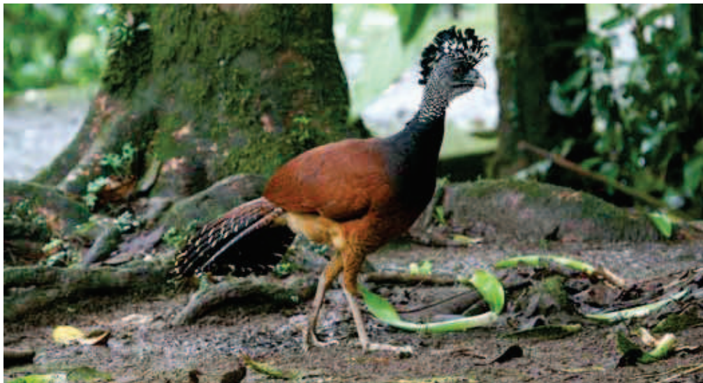
Lielā cekulvīsta Crax rubra .