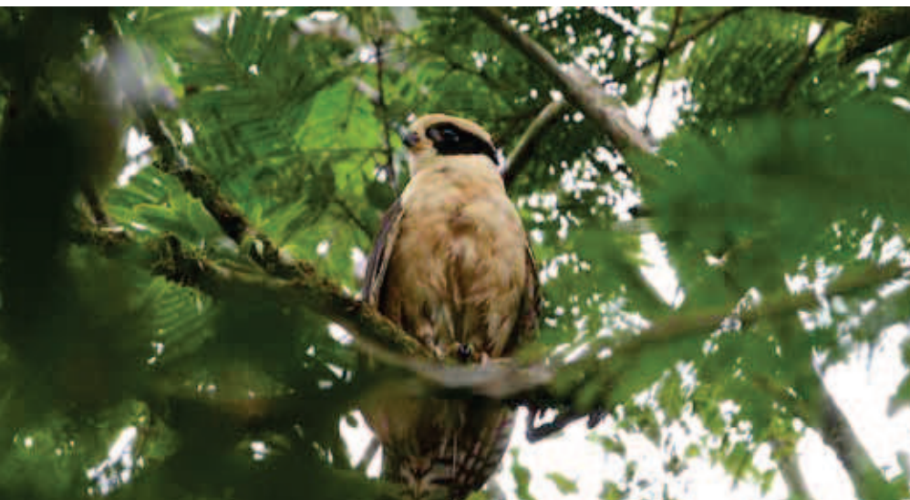
Smējējvanags Herpetotheres cachimans .