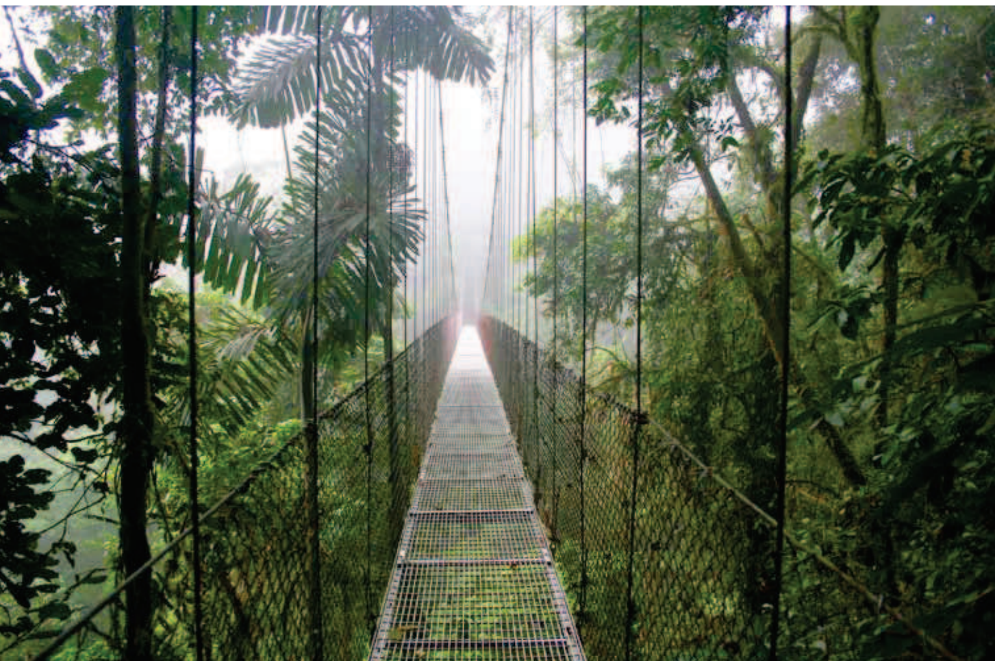
Iekārtais tilts dabas parkā Arenal Hanging Bridges.

Autora adrese: maris.pukitis@rigasvilni.lv