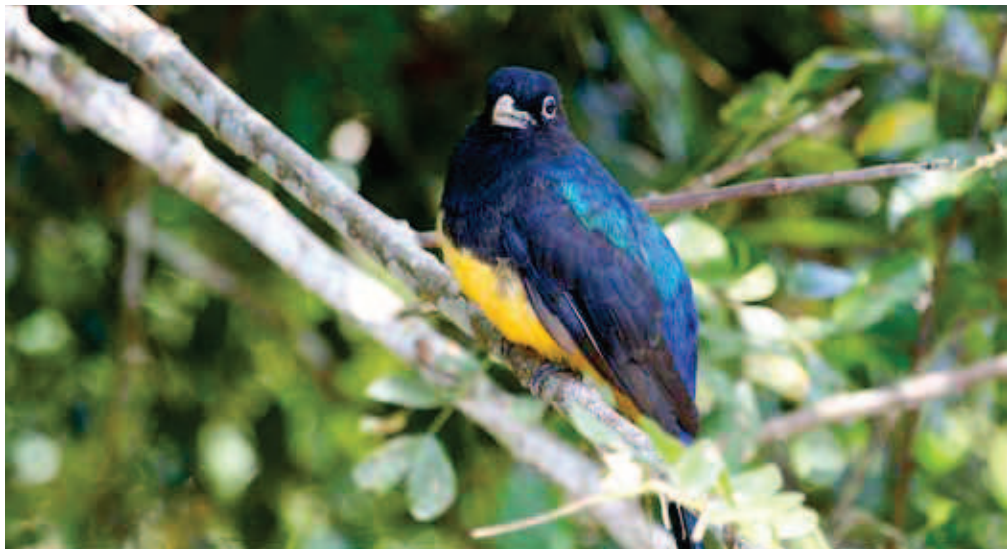
Pelēkastes trogons Trogon massena .