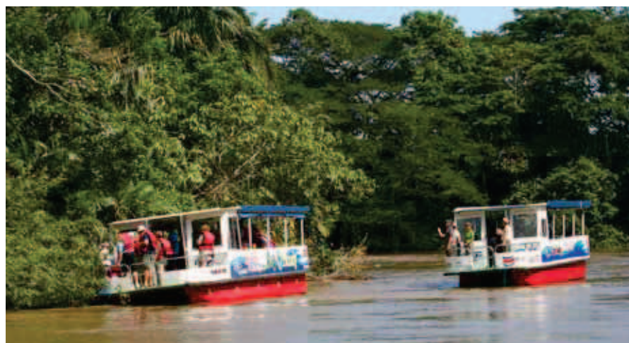
Tūristu motorlaivas Tortuguero apgalā.

Pēdējais ceļa posms veicams ar prāvām tūristu motorlaivām, kamēr mīnājos krastā, pamanos tuvāk iepazīt Kostarikas dabu – uz kājas sakāpj un sparīgi un sāpīgi kož sīkas skudriņas, no pēdējām tieku vaļā tikai laivā. Tūristu čemodānus, lai nemaisās pa kājām, iekrauj atsevišķā laivā, un atliek domāt, vai tiešām nekad neviens koferis neaiziet pa burbuli. Brauciens vijas cauri lietusesmežam, Tortuguero ir ūdeņu ieskaits apgabals, kur no vienas puses ir jūra, no citām – upes un kanāli, tā ka piebraukt var tikai ar laivām.