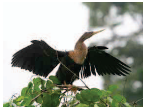
Amerikas čūskkaklis Anhinga anhinga .

Sagaidīšana bungalo tipa viesnīcā ir smalka, ar karstiem dvieļiem un spirdzinošiem augļu kokteiļiem. Uz kārtējo tūristu uzņemšanu no jumta kores filozofiskā mierā nolūkojas prāva iguāna. Vajadzētu aizvilkt čemodānu uz numuriņu, bet, paķēris atslēgu un ātri izmalkojis dzērienu, steidzu lūkot, kas ir tie putni, kas diezgan skaļi raida guldzošas skaņas. Šie skaistuļi ir Montesumas oropendolas Psarocolius montezuma , vālodžu radnieki. Oropendolas rosās augstu zaros, taču rīta agrumā nolaižas zemāk pēc ogām, tad arī izdodas iegūt pāris jēdzīgākus foto.