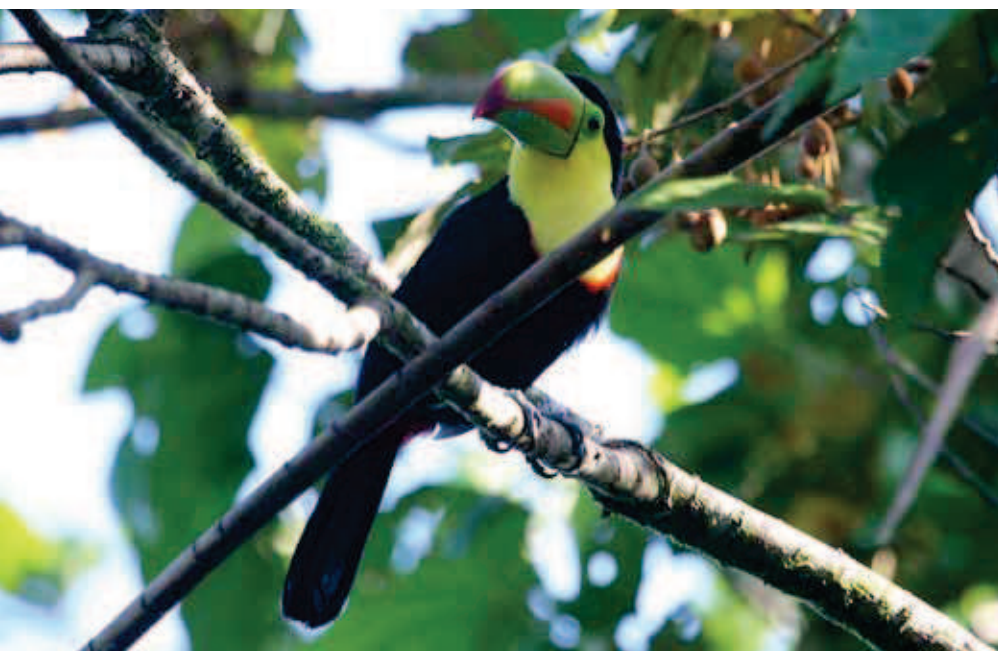
Raibknābja tukāns Ramphastos sulfuratus .