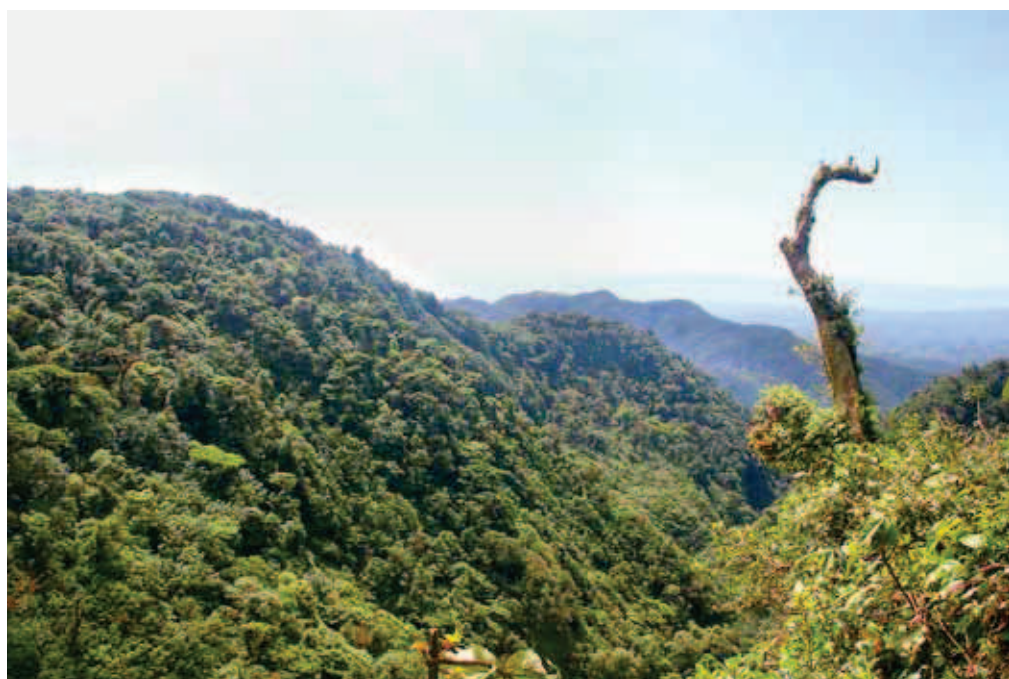
Pār Monteverdes lietusmežu tikko izklīdusi rīta migla.