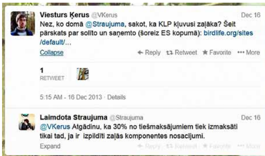
3. attēls. Ir liela iespēja, ka atbilde uz Twitter uzdoto jautājumu kādai publiskai personai tiks arī saņemta.

Ekrānsāviņš no V.Ķerus un L.Straujumas sarakstes Twitter.com