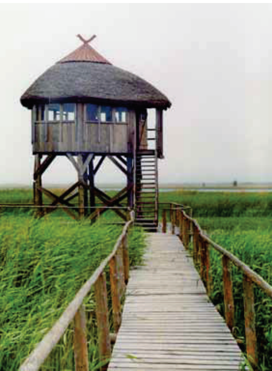
Papes putnu tornis, 23.06.1998.