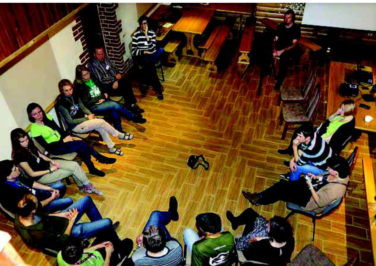
Kā barot putnus "pareizi"? Par to dalībnieki centās vienoties diskusijā.