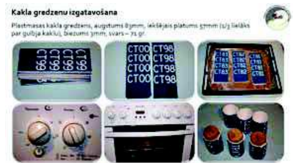
Gulbju kakla gredzeni tika “cepti” 200 grādos.