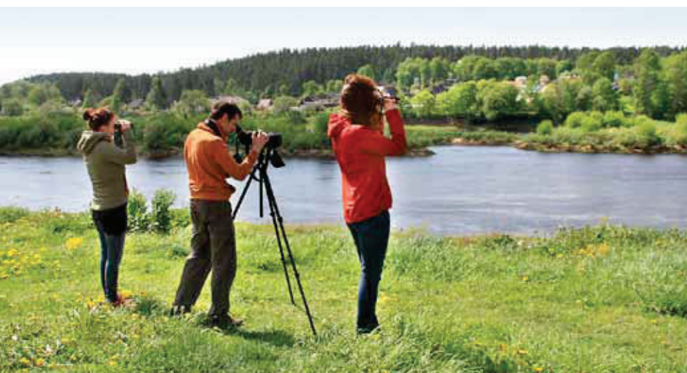
Komanda “4 Ibsi” veic novērojumus pie Daugavas.