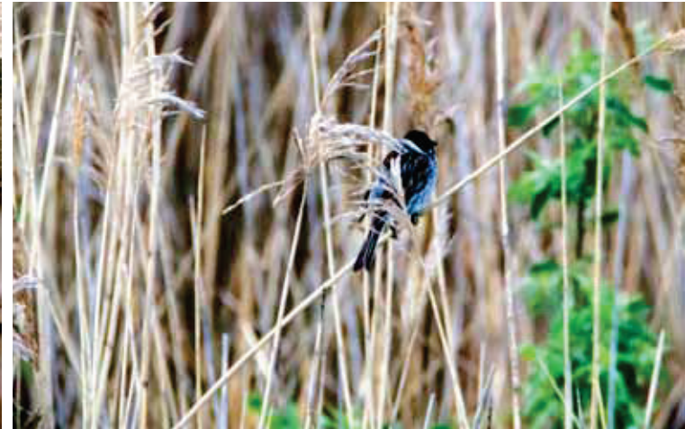
Pulksten 5.50 novērotā niedru stērste.