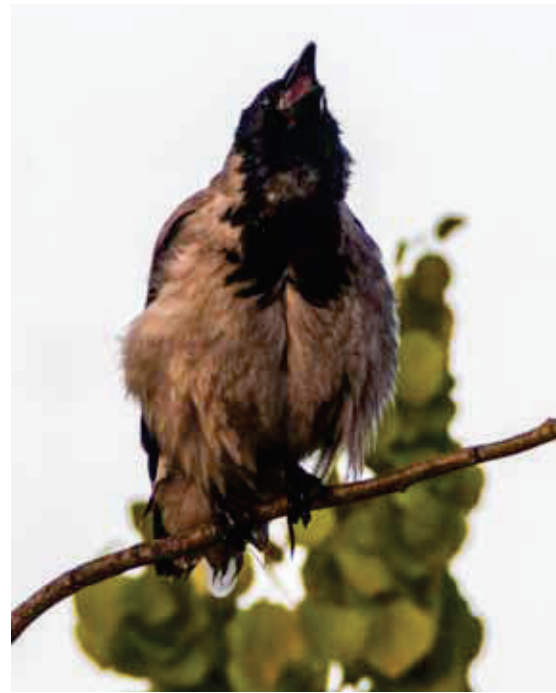
Pelēkā vārna, kas fotografēta ar Swarovski Optik piešķirto teleskopu un ieguvusi uzvarētājas godu digiskopijas kategorijā.