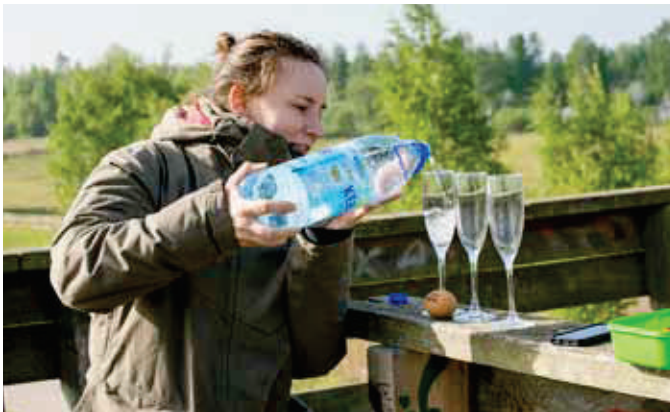
“Trulītes” ar vēsu minerālūdens glāzi svin četru stundu beigas.