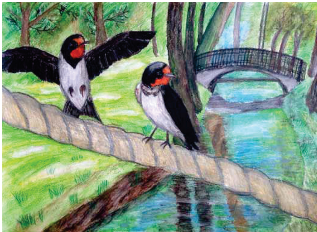
Lāsmas Neicenieces (15 g.v.) zīmējums ieguva 3. vietu Eiropā, saņemot grāmatu "Birds and People".

The program received over 600 (!) drawings for the 2016 edition of the Spring Alive contest of which more than 570 were received from Latvia, far more than in all of the Spring Alive history! Not only were we astonished with this exciting number of children that decided to participate in the "My Swallow" competition, but also humbled by the beauty of the artwork. The young authors sent us drawings and paintings showing either Barn Swallow(s) or House Martin(s) encountered by them e.g. while building nests, flying, catching insects, feeding offspring, etc. The winners were selected by a jury. In Latvia we received 1198 white stork, swallow, swift and cuckoo observations from 41 educational institutions. The most observations were reported by Lielvārde Primary School – 225.