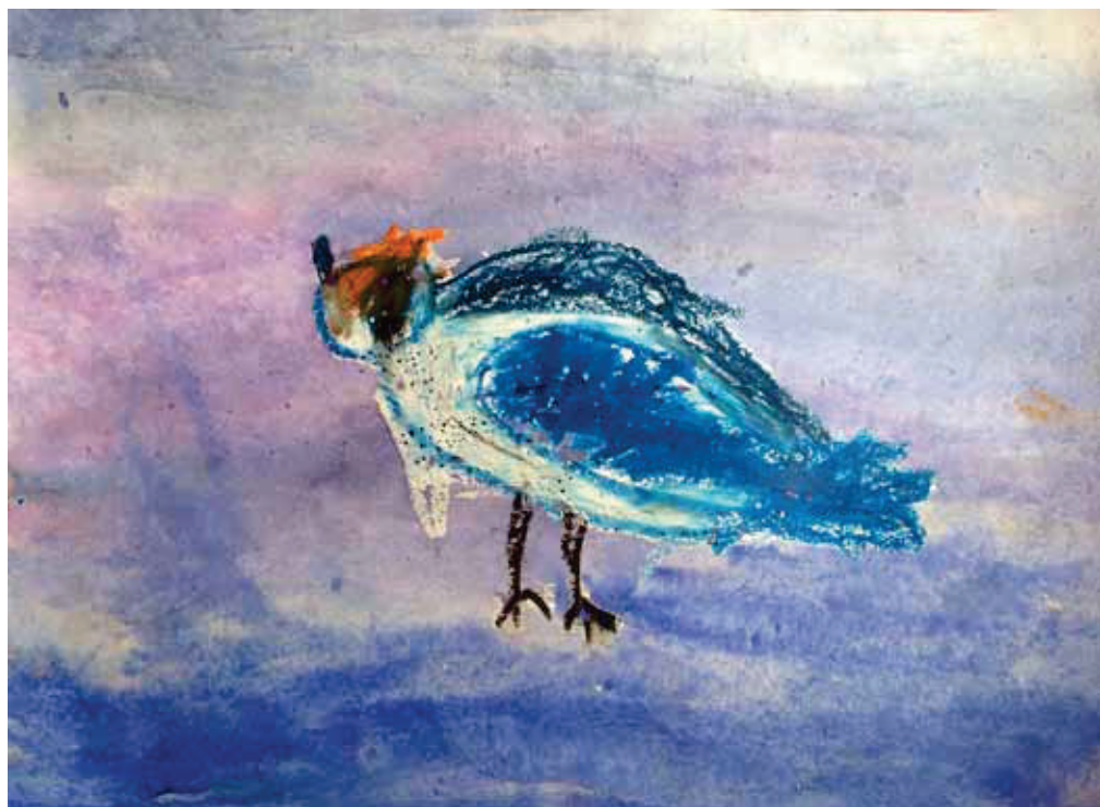
Edgars Lucaus (3 g.v.) saņēma veicināšanas balvu par savu zīmējumu.