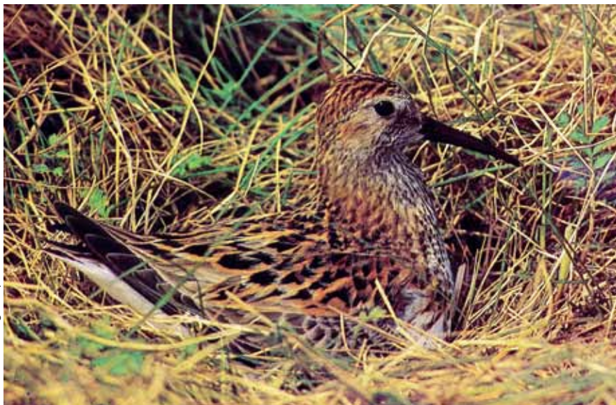
Šinca šņibitis Calidris alpina schinzii kādreiz ligzdoja Latvijā, bet pēdējā zināmā atrastā ligzda ir datēta ar 1997. gadu. V. Klimpiņa arhīvā ir labākās šīs sugas ligzdotāju fotogrāfijas no Latvijas.

ka otrs pāra putns ir zivju gārnis. Uz ligzdas uzņemtā fotogrāfija, kur var redzēt abus pāra putnus, tika vairākkārt publicēta gan pašmāju izdevumos (Baumanis, Kalniņš 1997; Klimpiņš 2001), gan arī ārzemēs (Baumanis 1998; Hancock 1999).