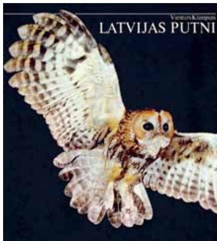
1986. gadā izdotā fotoalbuma "Latvijas putni" vāks.