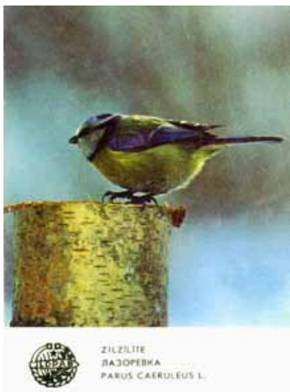
1987. gada kalendārs ar zilzilītes Parus caeruleus attēlu.