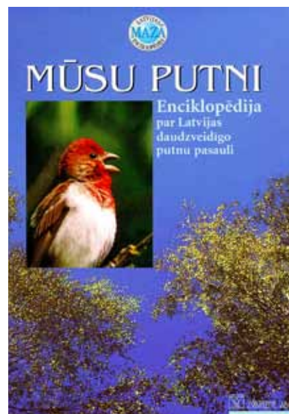
Enciklopēdijas “Mūsu putni” vāks, 2002. g.