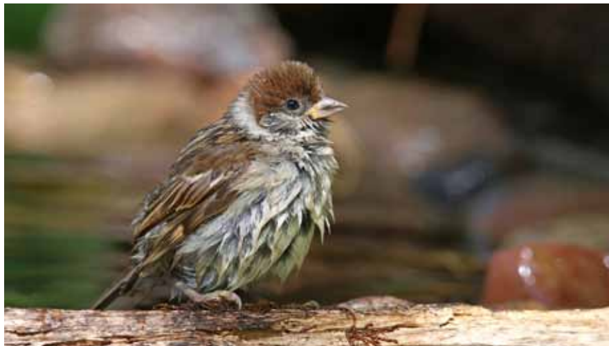
Mājas zvirbulis Passer domesticus .