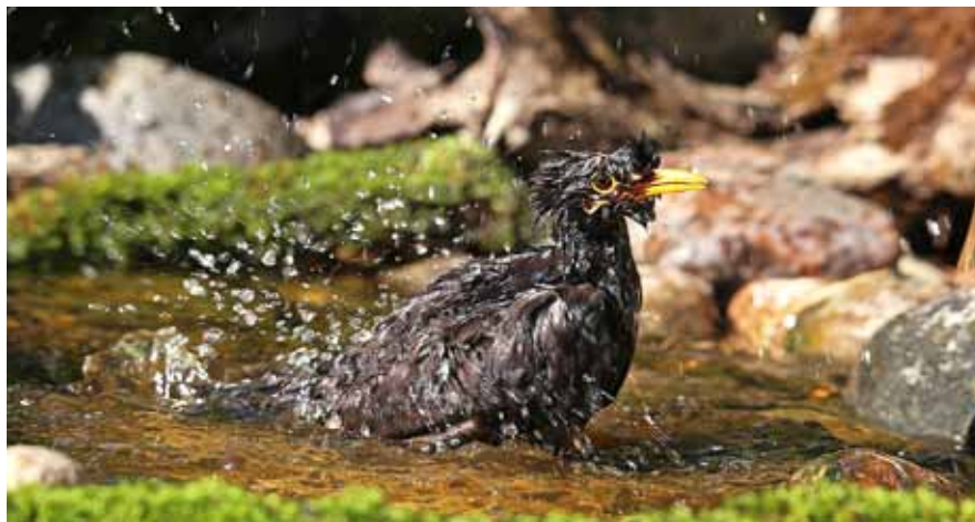
Melnais mežastrazds Turdus merula .