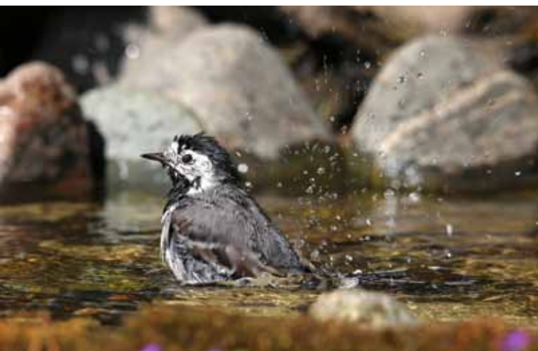
Baltā cielava Motacilla alba .