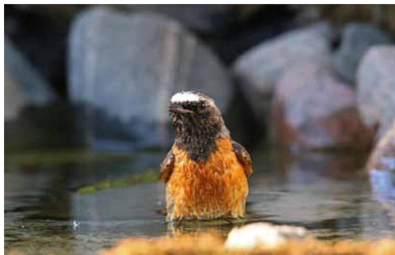
Erickiņš Phoenicurus phoenicurus .