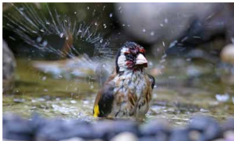
Dadzītis Carduelis carduelis .