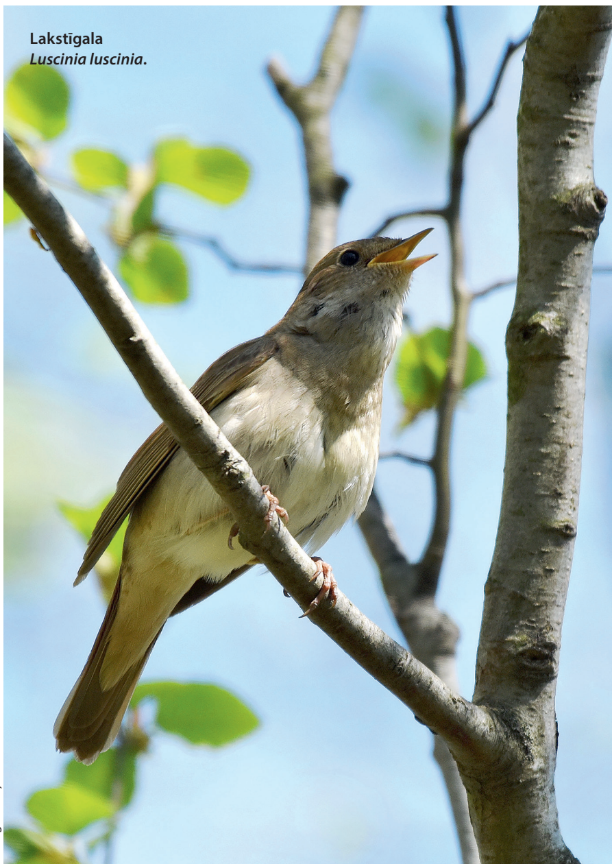
Lakstīgala Luscinia luscinia.

Arī dzīvotnes izvēle noteikusi to, kāpēc lakstīgalas dziesma mums pazīstama un mīļa, – lakstīgala nedzīvo dziļi mežā, bet gan upmalu un mežmalu krūmājos, dārzos un citās vietās, kur pieejami krūmi. Iedomājieties idealizētu Latvijas lauku ainavu, un skaidrs, ka tur būs vieta arī lakstīgalai.